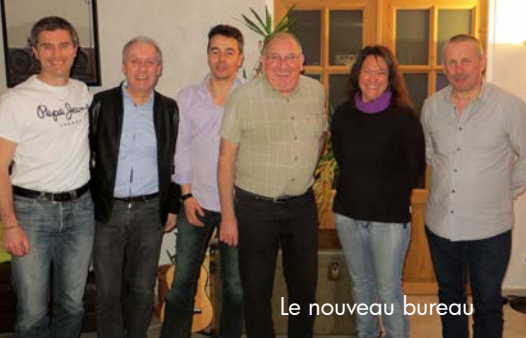
Le nouveau bureau