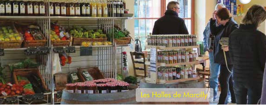
Les Halles de Marcilly