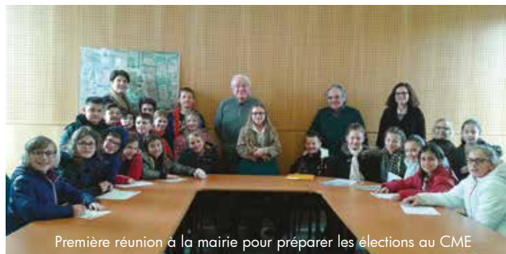
Première réunion à la mairie pour préparer les élections au CME

Au cours de cette journée, des ateliers avec les représentants de l'Unicef autour de la Convention Internationale des droits de l'Enfant seront organisés.