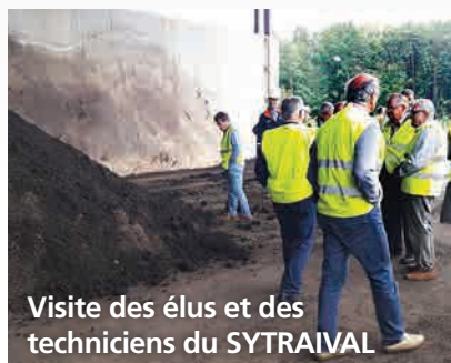
Visite des élus et des techniciens du SYTRAIVAL

Le 6 juin 2017, les élus et techniciens du SYTRAIVAL ont visité l'usine de valorisation bio-énergétique des déchets ménagers OVADE (ORGANOM) à Viriat (01). Cette unité traite et transforme par un tri mécano-biologique et un processus de méthanisation compostage les déchets ménagers. Ils pourront ainsi obtenir du biogaz, source d'énergie et du compost valorisable en agriculture.